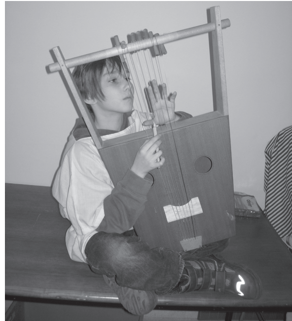
Abb. 4 Kind mit Kithara.

Wir führen Kostümführungen durch, bei denen sowohl wir uns in nach antiken Vorbildern geschneiderten Gewändern präsentieren, als