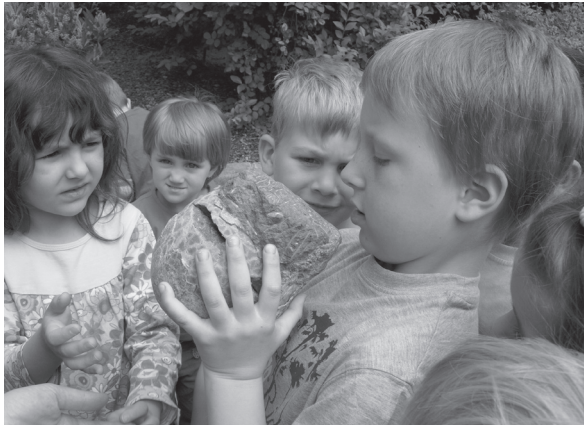
Abb. 2 Arbeit mit dem versteinerten Dinosaurierei.