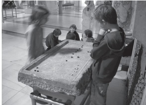
Abb. 3 Spieltisch, röm. Kaiserzeit, Ephesmuseum, Wien.

kann man auf die verschiedenen Arten der Zeitrechnung eingehen und das jeweilige Datum am Seil markieren. Die ägyptische Chronologie war an den Königslisten orientiert, die griechische durch die olympischen Spiele gegliedert (RASCHKA 2005; N.N. 1991, 184), die römische begann ab urbe condita , ab der Stadtgründung Roms 753 v. Chr., die buddhistische ab dem Todestag Buddhas 544 v. Chr. (KRAUSKOPF 1953) die islamische ab der Hidjra, der Auswanderung des Propheten Mohammeds aus Mekka 622 n. Chr. (GRÄBNER 2012; N.N. 1989, 63).