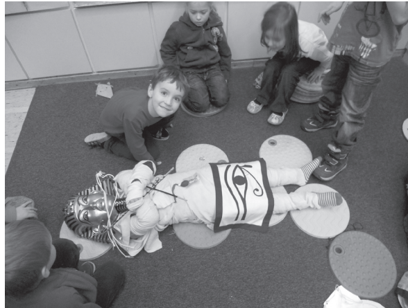
Abb. 5 Mumifizieren.

Damit wird der kritische Geist trainiert und aufgezeigt, dass die Kinder immer nachprüfen müssen, auch wenn etwas geschrieben oder im Film gezeigt wird.