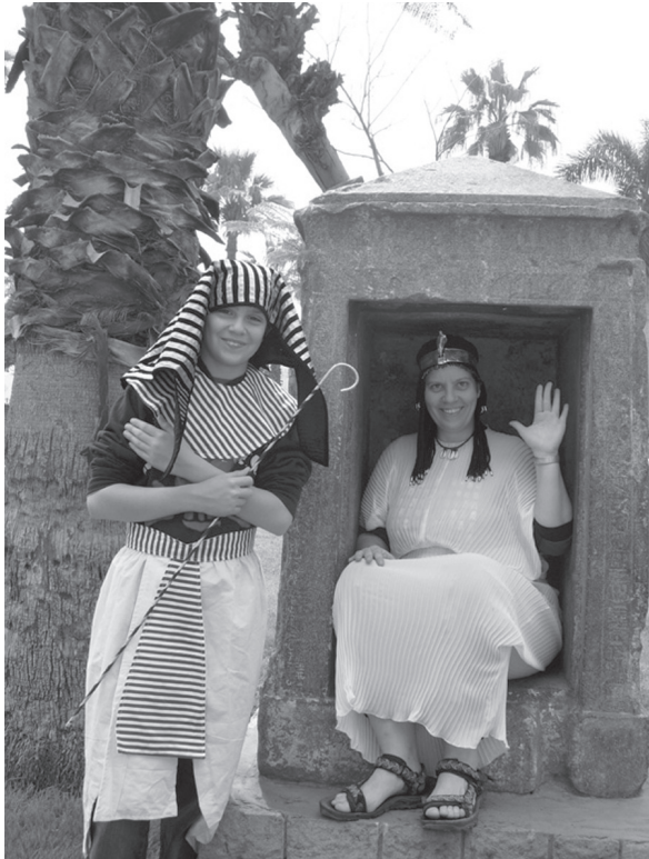
Abb. 6 Im Ägyptischen Museum in Kairo.

Cloaca Maxima, eine im ersten Moment sehr eigenwillig wirkende Kombination, bei der es um die Reinheit ging (HARRAUER & HUNGER 2006, 556; KÜHN 2012).